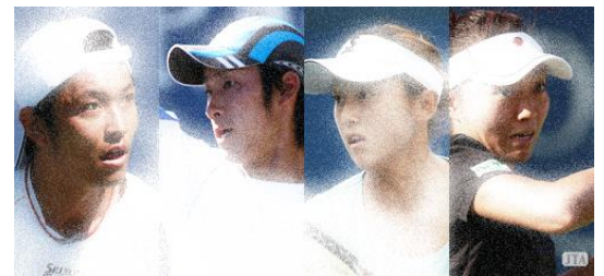
未来の日本を背負うジュニアへ

香榎園テニスクラブへ電話申込 お名前、連絡先、所属、年齢、居住市をお伝えください。