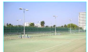
最高のロケーション(南は浜辺)

参加費 ご予約のうえ当日¥2,000(税込)をお支払いください 表彰 各ブロックの優勝者には賞品贈呈 その他の方は参加賞進呈